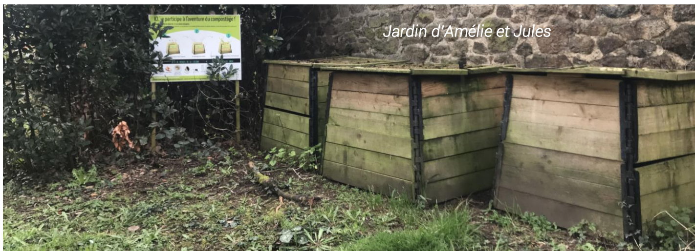
Jardin d'Amélie et Jules