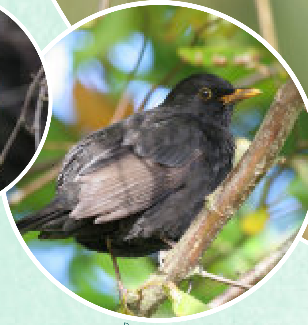
B - Merle