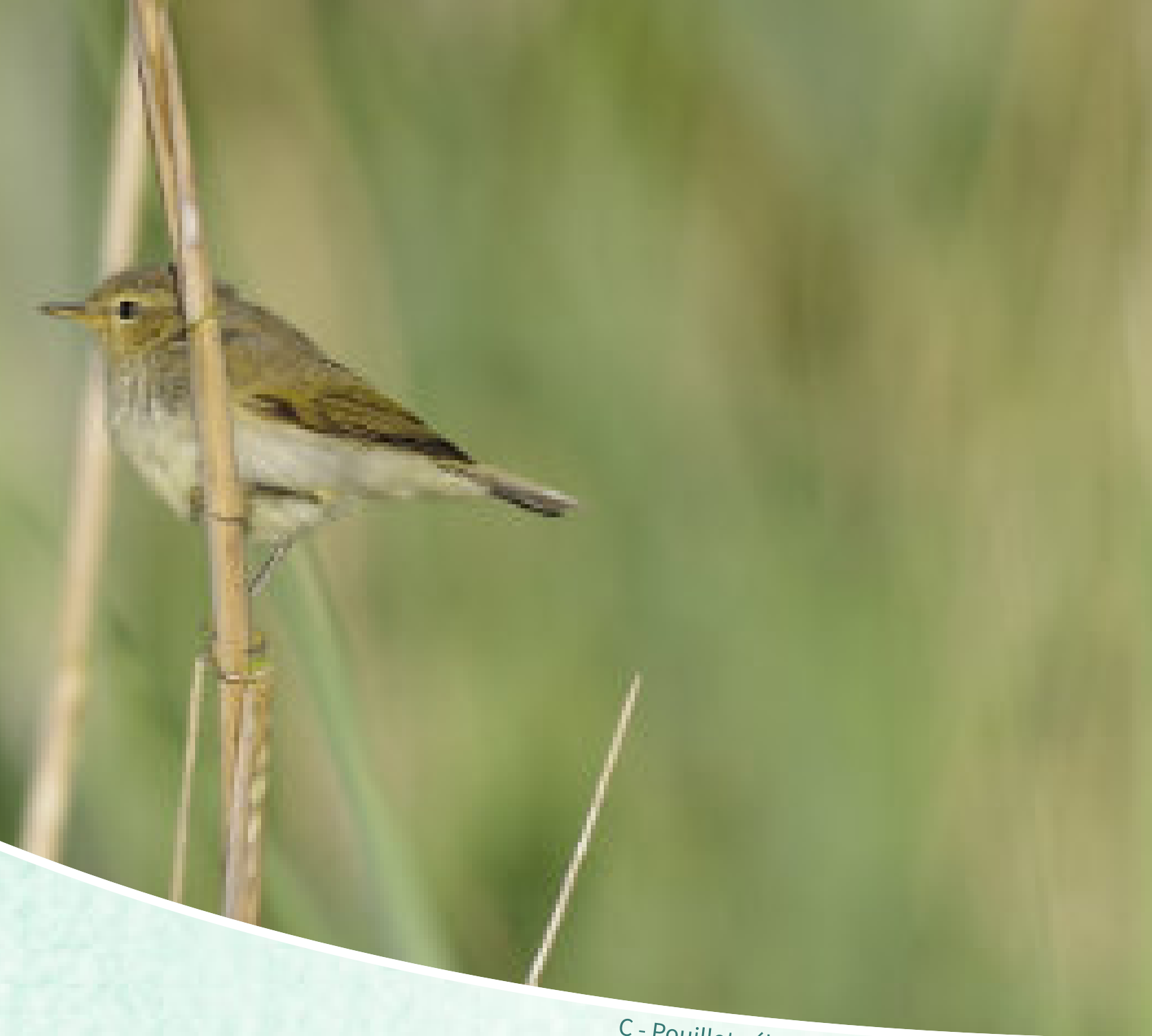
C - Pouillot véloce