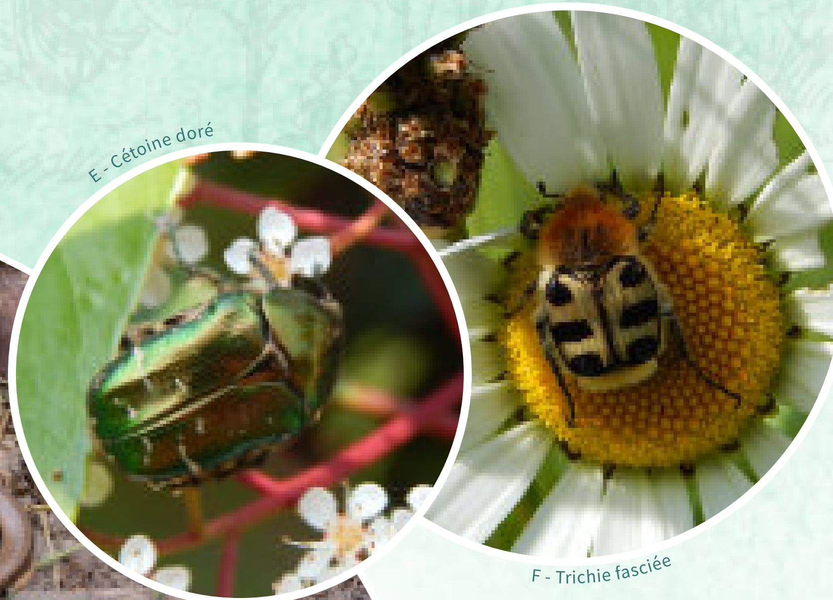
F - Trichie fasciée