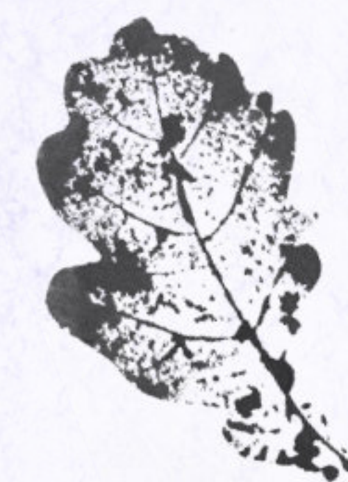
Illustration et pas-à-pas réalisés par Céline Dodeman www.celine-dodeman.com

Surlignez certains éléments au feutre noir pour donner plus d'intensité, vous pouvez également ajouter du texte manuscrit.