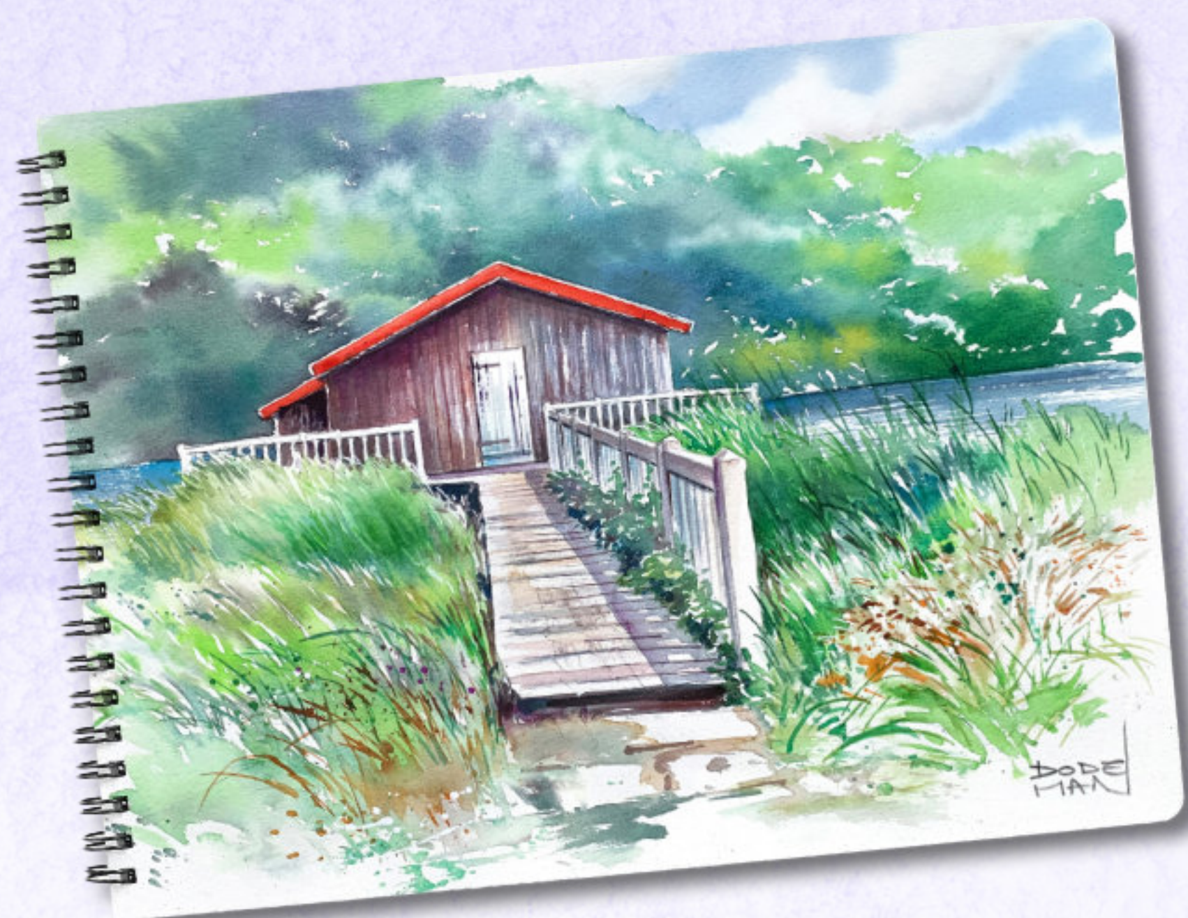
Illustration et pas-à-pas réalisés par Céline Dodeman : www.celine-dodeman.com

7 Finaliser avec quelques réhauts de couleur. L'effet foisonnant de cette masse végétale donnera du dynamisme à votre composition.