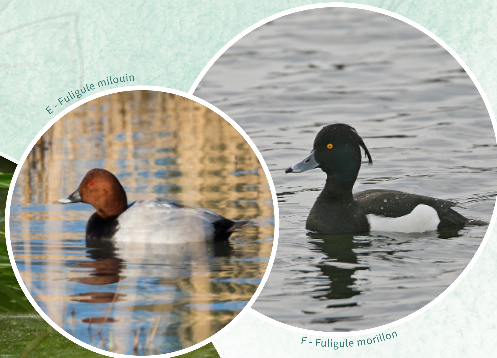
E - Fuligule milouin

Voici l'automne et les migrateurs repartent vers le sud. Vous aurez peut-être la chance de voir le Balbuzard pêcheur attraper un poisson. Si les visiteurs d'été quittent les lieux, les Mouettes rieuses sont de retour pour un nouvel hivernage à Bazouges.