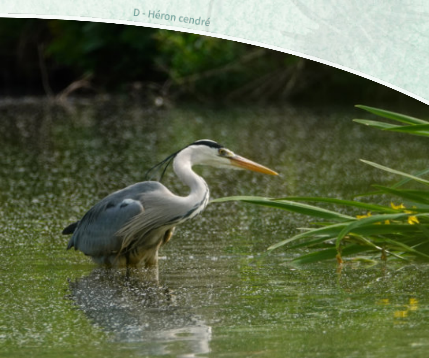
D - Héron cendré