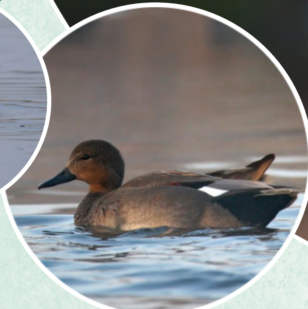
B - Canard chipeau