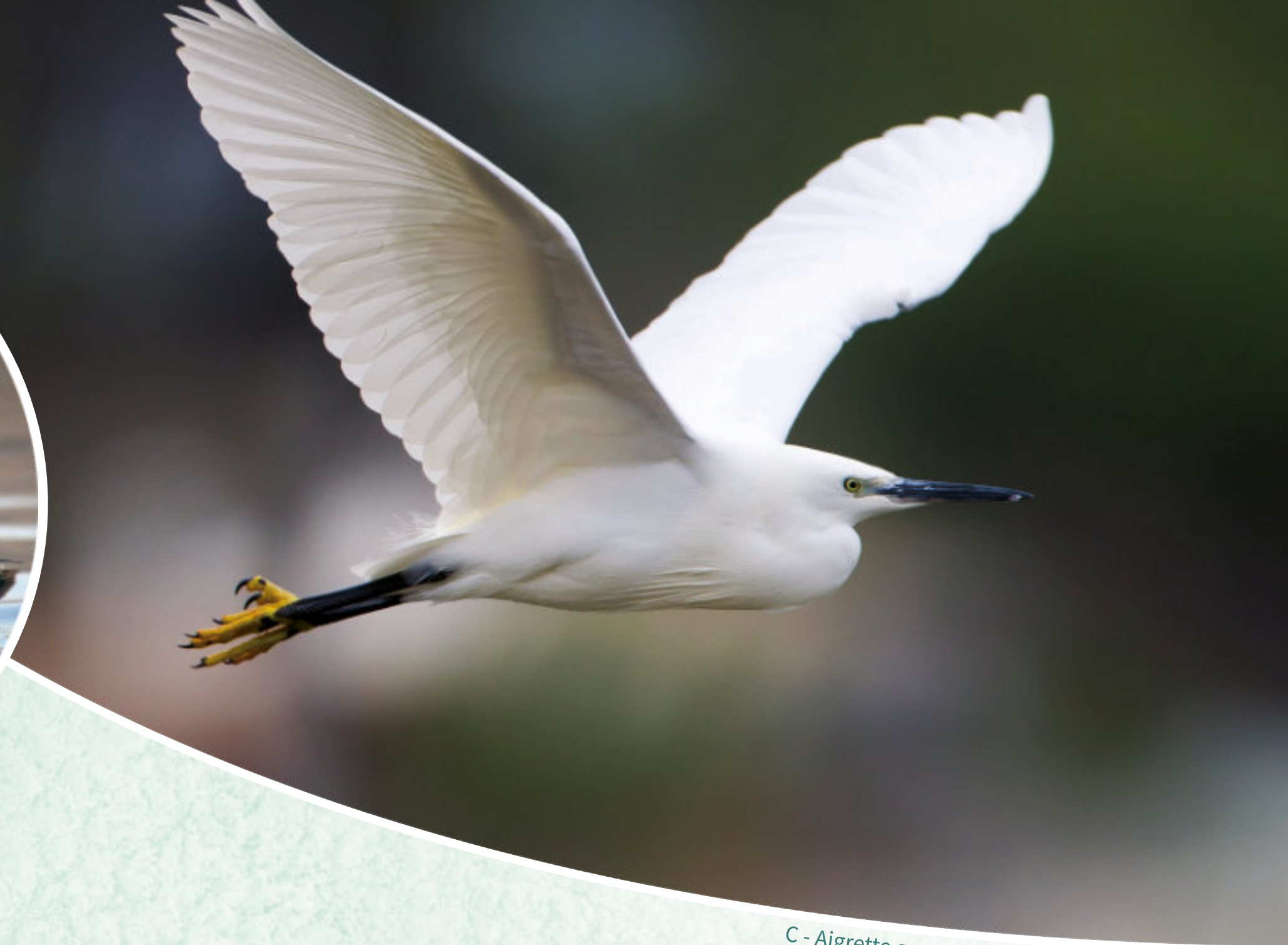
C - Aigrette garzette

La famille des hérons est aussi bien représentée quand le niveau d'eau leur convient : Héron cendré , Aigrette garzette et Grande Aigrette .