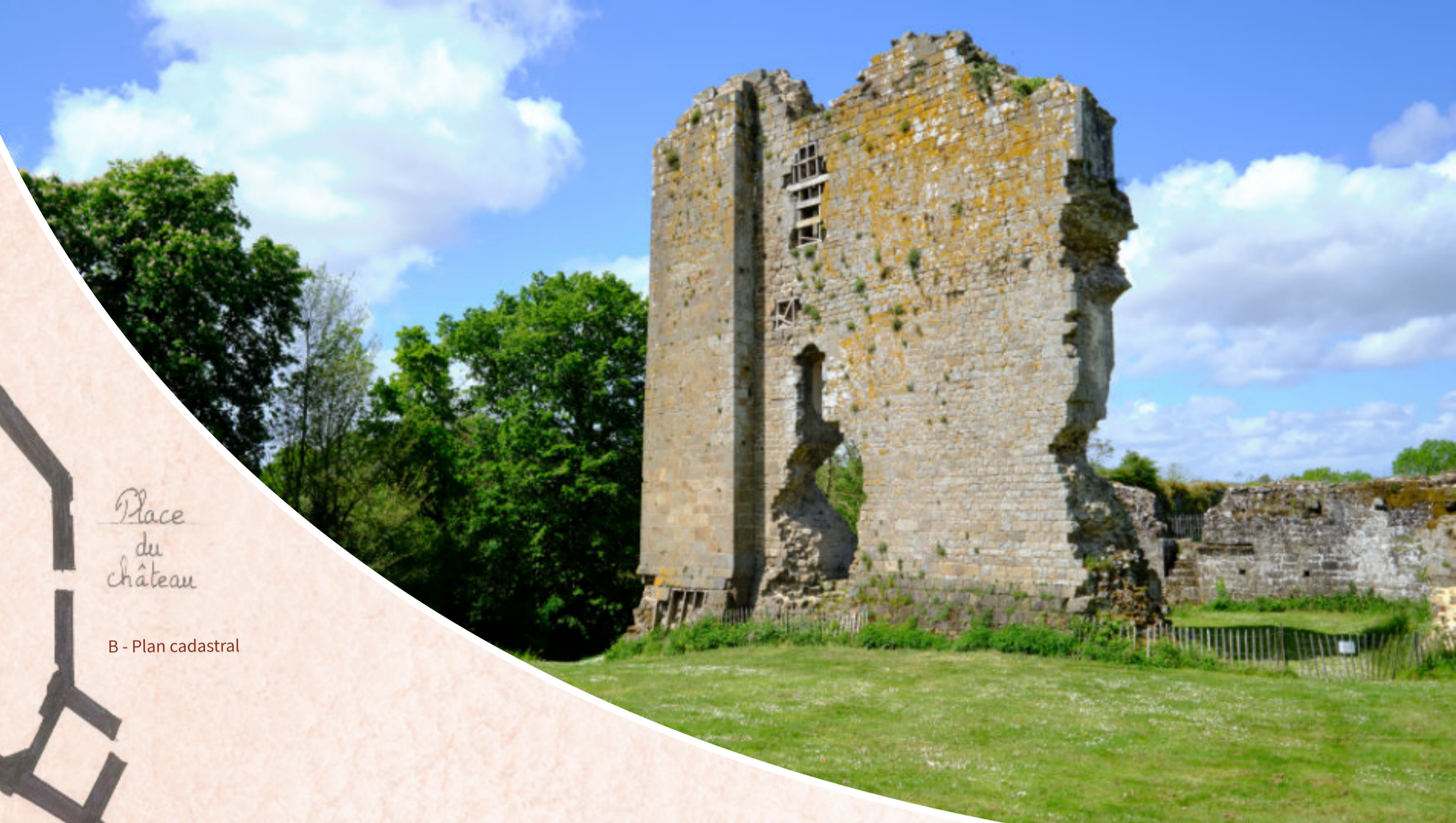
C - Les vestiges du château

Remerciements aux élèves pour leur implication, à la mairie de Hédé-Bazouges, à Guillaume Feudé (pour son aide à la relecture), à Christian Veyre (pour son aide à la mise en page), à Patrice Bonjour (pour ses nombreux documents disponibles http://patrice.bonjour.free.fr ) Texte : Source - Le petit tacot - janvier 2016, les écrits historiques Paul Banéat, Alfred Anne-Duportal, Christophe Amiot, Alain Salamagne. Crédits photos et dessins : Elèves de CM1-CM2, école des Courtillets (2018) Conception : UNILIC studio graphique & Christelle Carré Avec le soutien de l'Union Européenne et de la Région Bretagne