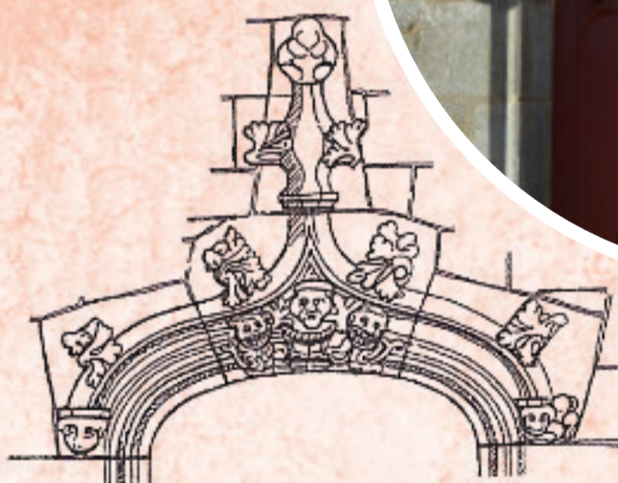
F1 - Dessin de la porte sud